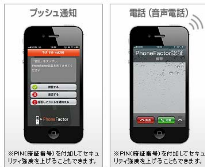
複数の手段で多要素認証を提供する PhoneFactor

PhoneFactor は、スマートフォンや携帯電話を使って本人認証を強化する多要素認証ソリューションです。使い方は非常に簡単です。Office 365 の本人認証時に、ユーザーのスマートフォンの認証アプリへプッシュ通知もしくはセンターから自動でユーザーに電話をかけることで認証を行います。悪意のある第三者がユーザーの ID/パスワードで Office 365 にログインを試みても、ユーザーのスマートフォン・携帯電話に PhoneFactor データセンターからプッシュ通知もしくは電話がかかってくるため、なりすましに気づいたユーザーは即座に自分のアカウントをロックすると同時に、管理者に不正アクセスがあった旨を通知することができます。